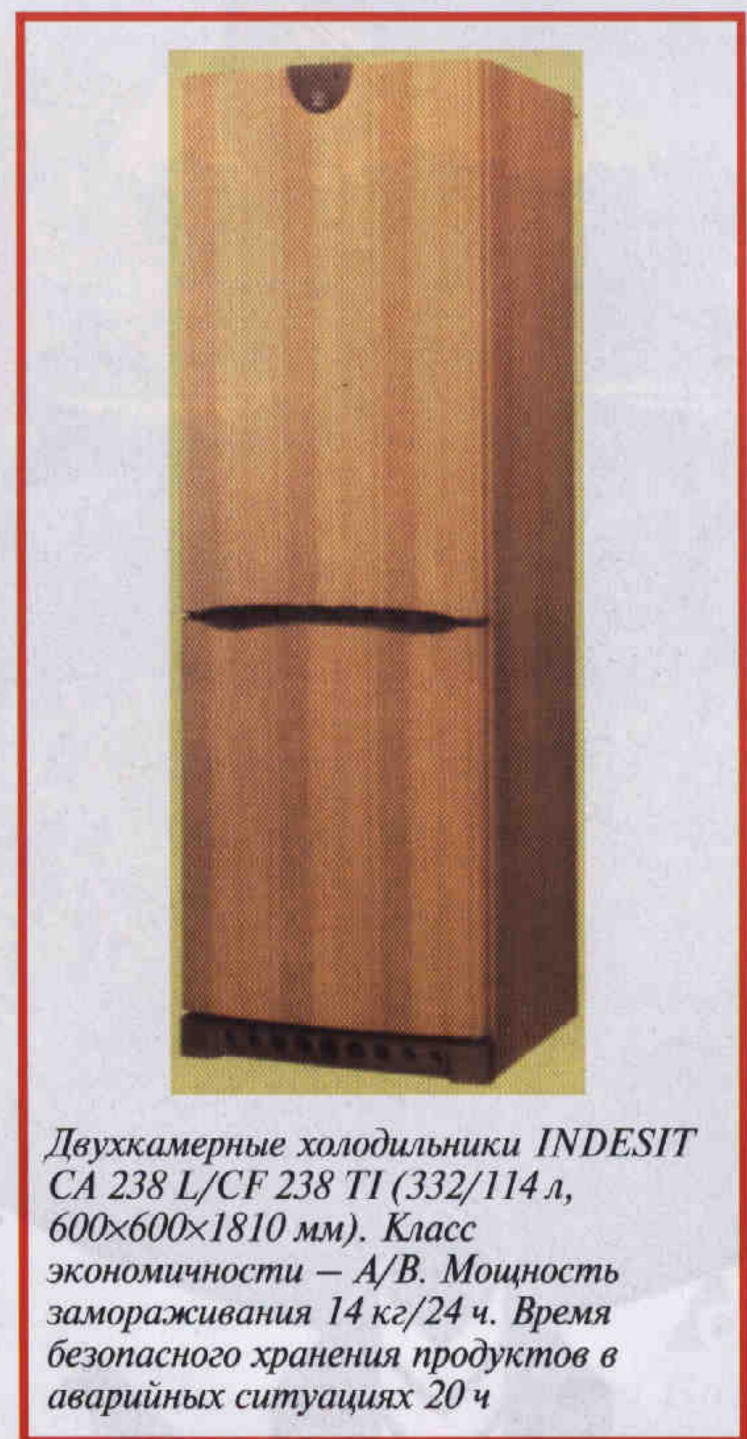
Двухкамерные холодильники INDESIT CA 238 L/CF 238 TI (332/114 л, 600×600×1810 мм). Класс экономичности – А/В. Мощность замораживания 14 кг/24 ч. Время безопасного хранения продуктов в аварийных ситуациях 20 ч

Новые модели ELEKTROLUX имеют округлые формы дверей, напо-