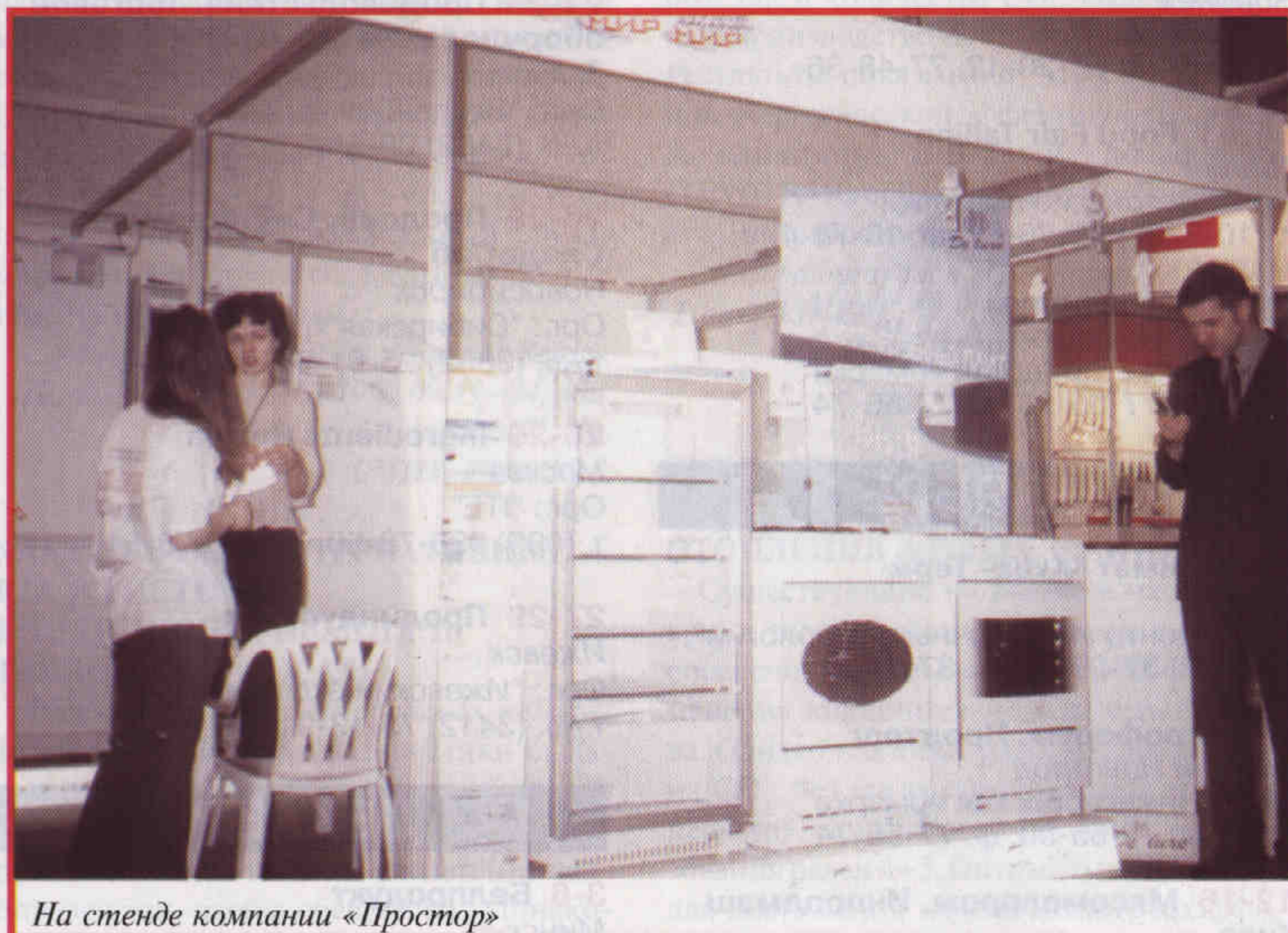
На стенде компании «Простор»

Холодильники известных российских марок «Бирюса», «Саратов» и «Смоленск» были обозначены без широкой рекламы на стенде компании «КАСИС».