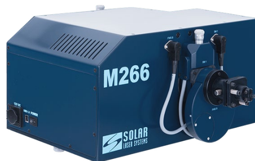
Рис. 2. Внешний вид автоматизированного монохроматора/спектрографа M266 фирмы SOLAR.

Fig. 1. Illustrated concept of the study on the process environment of the optical spectrum.