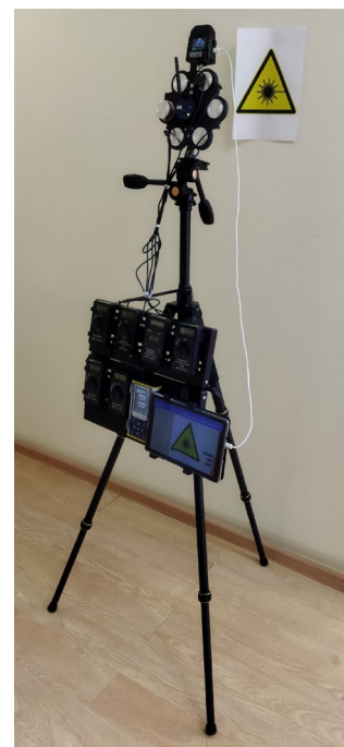
Рис. 4. Фотография специализированного стенда измерения энергетических характеристик отраженного излучения. Fig. 4. Photo of a special bench used to measure reflected radiation energy parameters.