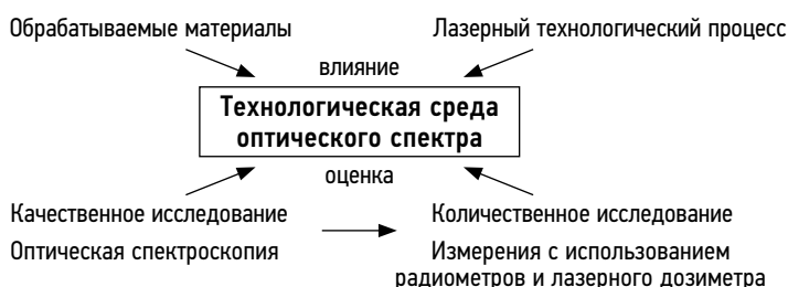
Рис. 1. Иллюстрация концепции исследования технологической среды оптического спектра.

Из рис. 3 видно, что самый интенсивный спектр зафиксирован при обработке титанового сплава ВТ6. Спектры плазмы образцов стали 09Г2С и 12Х18Н10Т по многим линиям совпадают. Спектр плазмы образца алюминиевого сплава АМг6 имеет наименьшую относительную интенсивность по сравнению с остальными. Экспериментально было установлено, что плазма, возникающая от воздействия ЛИ на обрабатываемый материал, создает спектр излучения, образованный многочисленными полосами, которые располагаются в УФ, видимой и ИК-областях спектра. Эти значения характерны для исследованных материалов [5].